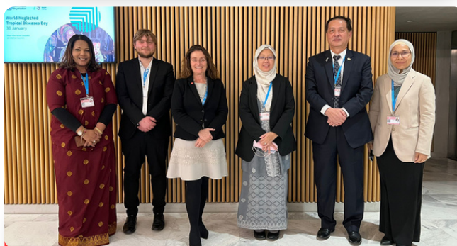
ADI se reúne con la delegación de Malasia, incluida la Ministra de Salud, Dra. Zaliha Mustafa, durante el 152º Consejo Ejecutivo de la OMS