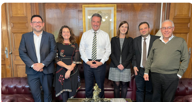
Miembros del equipo de ADI con el Ministro de Salud de Uruguay, Dr. Daniel Salina, durante una reunión en octubre de 2022.

Defina claramente la finalidad y los objetivos de la reunión, así como los puntos clave que quiere transmitir. Mantenerse al día con los desarrollos políticos también es crucial, como el seguimiento de los cambios en los altos funcionarios de salud, incluidos los Ministros de Salud, y su postura sobre cuestiones relacionadas con la demencia.