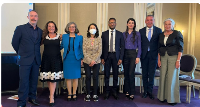
Representantes de los gobiernos, incluidos los Ministerios de Salud, se unen a menudo a ADI en su debate anual sobre el informe From Plan to Impact.